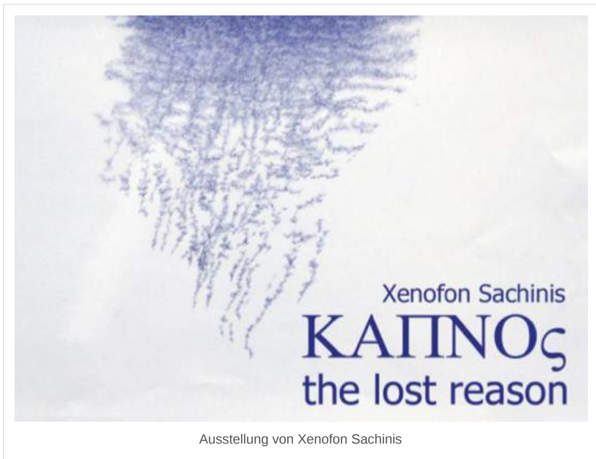
Ausstellung von Xenofon Sachinis

von Anton Launer • 8. Februar 2016 • Kommentare deaktiviert